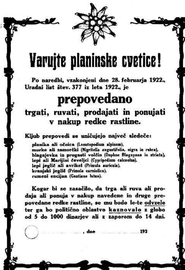
Slika 27. Lepak z imeni najbolj ogroženih rastlinskih vrst, ki ga je leta 1922 izdal odsek za varstvo narave pri Muzejskem društvu Slovenije

o zaščiti. Ta zakon je bil med prvimi zakonodajnimi akti nove Jugoslavije in izpričuje pomen varstvene dejavnosti in daljnovidnosti ljudi v novi vladi. Takoj nato so bili tudi že predpisani pravilniki o izvajanju zakona o zaščiti. Zvezna ljudska skupščina je 4. oktobra 1946 potrdila zakon z dne 23. julija 1945 in ga 8. oktobra razglasila kot splošni zakon o zaščiti z naslovom »zakon o potrditvi in spremembah zakona o zaščiti kulturnih spomenikov in prirodnih znamenitosti Demokratične Federativne Jugoslavije« (Ur. l. DFJ št. 81/46). Ta zakon je bil podlaga za republiške zakone o zaščiti in za ustanavljanje posebnih zavodov, ki naj zaščitno izvajajo. Prvi republiški zakon o varstvu kulturnih spomenikov in prirodnih znamenitosti je bil razglašen šele 21. maja 1948 (Ur. l. LRS št. 23/48). Ker je bil 23. oktobra 1946 razglašen tudi zakon o razveljavljanju pravnih predpisov, izdanih pred 6. aprilom 1941 in med sovražno okupacijo (Ur. l. LRS št. 86/46), je bilo treba obnoviti tudi vse varstvene odločbe in uredbe iz prejšnjih let.