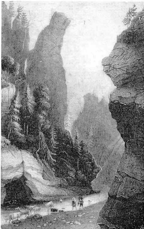
Slika 24. Bakrotisk iz sredine XIX. stoletja kaže ozko Savinjsko sotesko med Lučami in Solčavo in v njej naravni spomenik Iglo, zanimivo, zgoraj odmaknjeno skalno, ki jo je ti-sočletja delujoča erozija z vedno širšo špranjo ločila od matične gorske gmote. Današnje ceste po dolini takrat še ni bilo