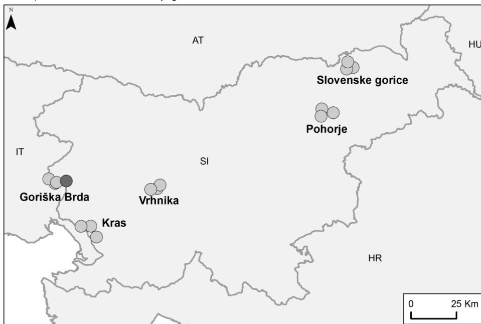
Figure 1. Location of churches included in the study. Sabotin (test location without prior illumination) is marked by a dark dot, other churches are marked by light dots.

Popisi so potekali v treh zaporednih sezonah, od 2011 do 2013. V eni sezoni je bilo opravljenih šest popisov od sredine maja do sredine septembra. Popisovati smo začeli vsaj eno uro po navtičnem mraku. Na vsakem objektu smo popisovali metulje na fasadi in okolici reflektorjev 45 minut; ta časovna omejitev nam je omogočila, da smo v eni noči obiskali vse cerkve v enem trojčku. Popisi so potekali ob ugodnem vremenu (brez dežja, rahel veter) in vsaj en teden pred ali po polni luni. Na vsaki cerkvi smo popisovali številčnost metuljev na vzorčni ploskvi velikosti 10×3 m, na drugih osvetljenih delih fasade in okoli reflektorjev pa smo zgolj beležili pojavljanje vrst. V tem prispevku prikazujemo favnistične podatke. Večina vrst je bila determinirana na terenu, druge pa so bile ulovljene in so shranjene v zbirkah avtorjev. Za določitev smo uporabili standardne priročnike za nočne metulje in Microlepidoptera (npr. Fajčik & Slamka 1998, Belin 2003, Fajčik 2003, Mironov 2003, Leraut 2012, 2014).