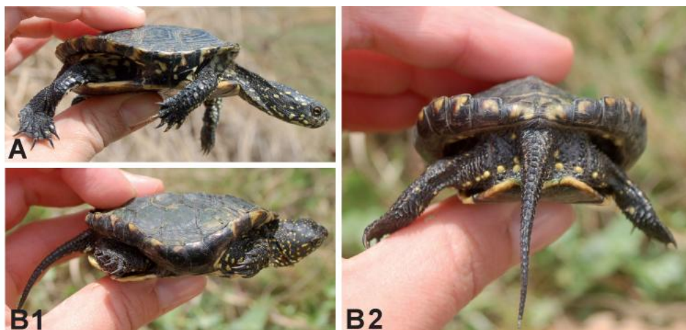
Slika 3. Anomalije oklepa pri dveh subadultnih osebkih močvirske sklednice ( Emys orbicularis ) v kalu Golek, Bela krajina. Oznaki A in B ponazarjata različne osebke.

V močvirju Zjot (Mlaka) smo ujeli 3 samice močvirske sklednice. Dve sta spadali v razred mlajših adultov, ena pa v razred med 2–10 let starih želv.