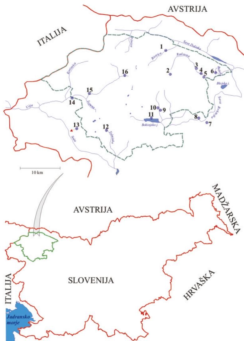
Slika1. Zemljevid Slovenije z označenimi vzorčnimi mesti (SZ Slovenija) (1 = Vrata 2 = Krma, 3 = Frčkov rovt, 4 = Zatrep, 5 = Lipnik, 6 = Črna rečica, 7 = Soteska, 8 = Nomenj, 9 = Kropa, 10 = Voje 11 = pri Boh. jezeru, 12 = Tolminka, 13 = Tresli, 14 = Kršovec, 15 = Roja, 16 = Krajcarica)